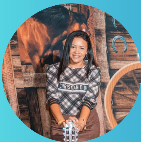
Nair Costa Ass. Jurídicos