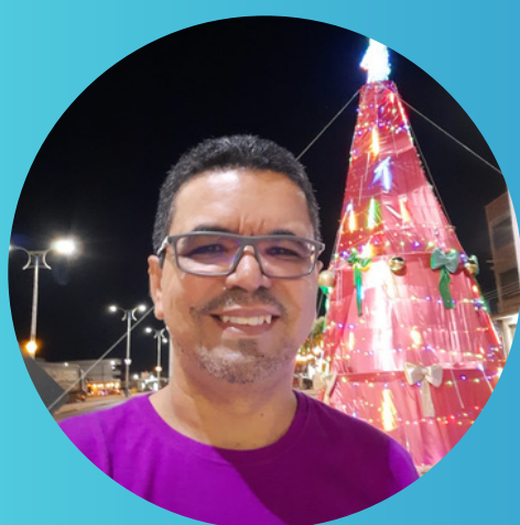
Jakson Duarte Comunicação